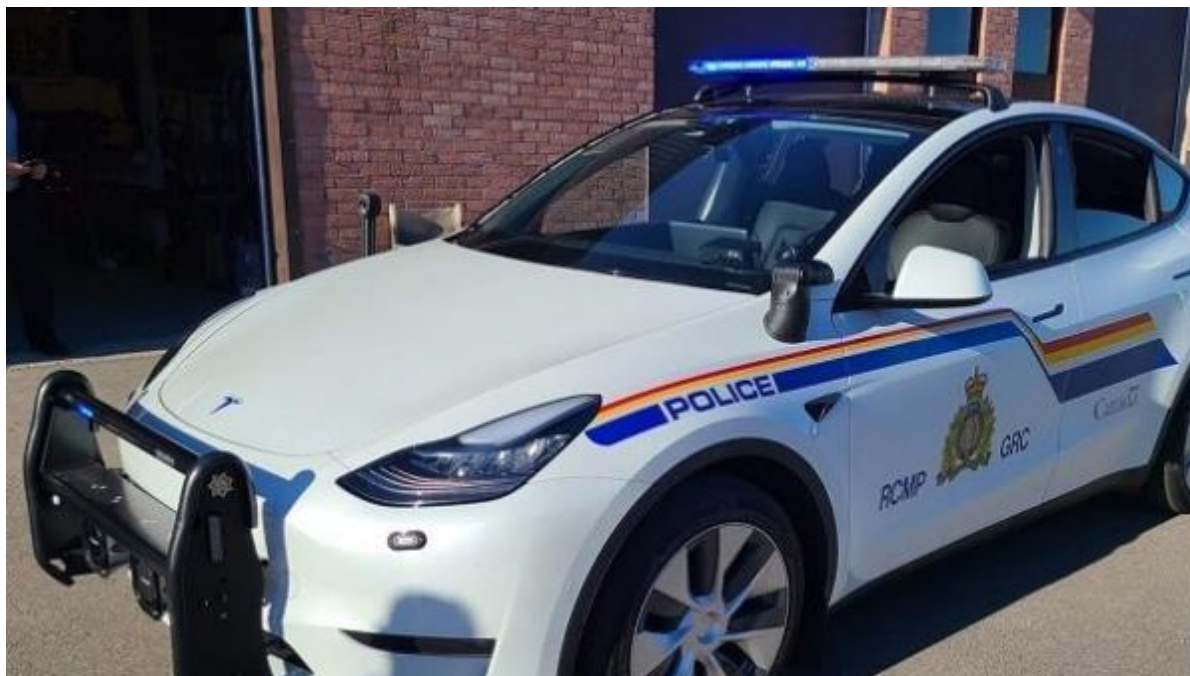
En 2023, le Détachement de West Shore a dévoilé le premier véhicule entièrement électrique de la GRC, un Tesla Model Y, entièrement équipé pour répondre aux normes policières.

La GRC dispose d'un parc de véhicules terrestres, aériens et maritimes pour répondre à ses besoins opérationnels. Le parc de véhicules de sûreté et de sécurité nationales (SSN) de la GRC comprend 14 000 véhicules terrestres qui permettent aux membres de fournir des services de police partout au Canada. Il s'agit de véhicules légers (berlines, véhicules utilitaires sport, camionnettes et fourgonnettes), de véhicules moyens et lourds, de motos et de nombreux véhicules hors route (motoneiges, véhicules tout-terrain, véhicules utilitaires tout-terrain) qui répondent à un large éventail de besoins opérationnels (camions à bombes, camions à chiens, postes de commandement mobiles, chargeurs frontaux, plates-formes de véhicules blindés, etc.).