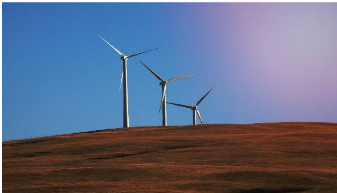
SaskPower et le Canada travaillent de concert au développement d'une nouvelle infrastructure d'électricité renouvelable qui produira et fournira au réseau électrique local une puissance équivalente à la consommation des bâtiments et installations de la GRC en Saskatchewan.

La GRC effectue régulièrement des examens de contrôle de la qualité préalables aux appels d'offres 5 . Dans le cadre de ce processus, elle intègre des critères environnementaux aux documents contractuels. Afin de progresser vers l'atteinte des objectifs de la Politique d'achats écologiques, la GRC examinera et mettra à jour les outils et les conseils fournis aux responsables des achats, en se concentrant sur le renforcement des critères environnementaux appropriés pour les catégories de biens et de services qui ont un impact élevé.