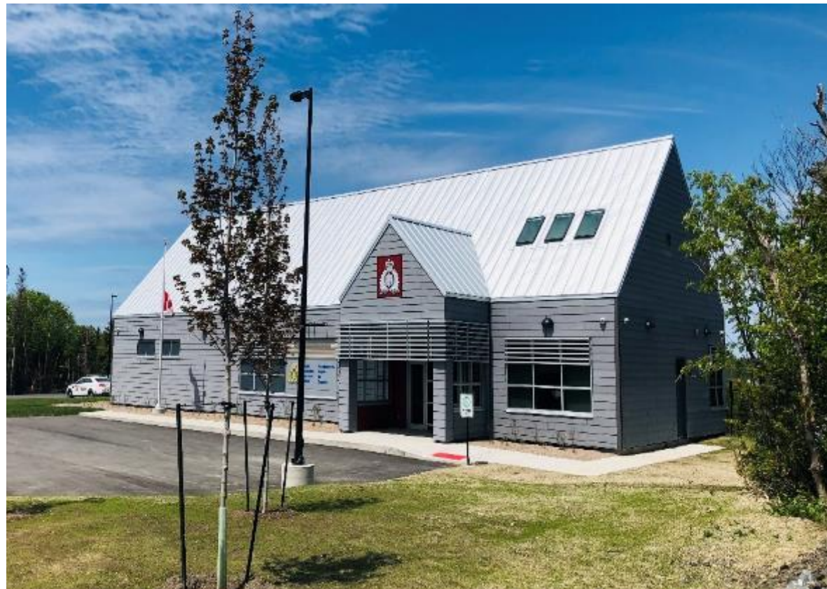
Inauguré en 2021, le Détachement de la GRC de Rocky Harbour (T.-N.-L.) est un bâtiment carboneutre qui comprend une conception thermique de pointe, ainsi qu'un éclairage et des installations sanitaires automatisés.

La GRC s'efforce également de remplacer ou de convertir, d'ici 2030, les systèmes de chauffage, de ventilation, de climatisation et de réfrigération (CVCR) existants qui utilisent des réfrigérants à fort potentiel de réchauffement